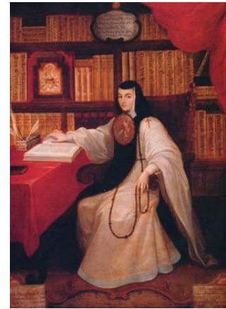
Retrato de Sor Juana Inés de la Cruz, Miguel Cabrera, 1750.

La religiosa-intelectual Sor Juana Inés de la Cruz (1648*-1695) 2 , conocida como la fénix de México, ícono literario y cultural de la sociedad novohispánica, siglo XVII, dejó como herencia literaria, social y política para la historia de la humanidad, especialmente, para la historia de América Latina, registros y testimonios de una lucha femenina de valor